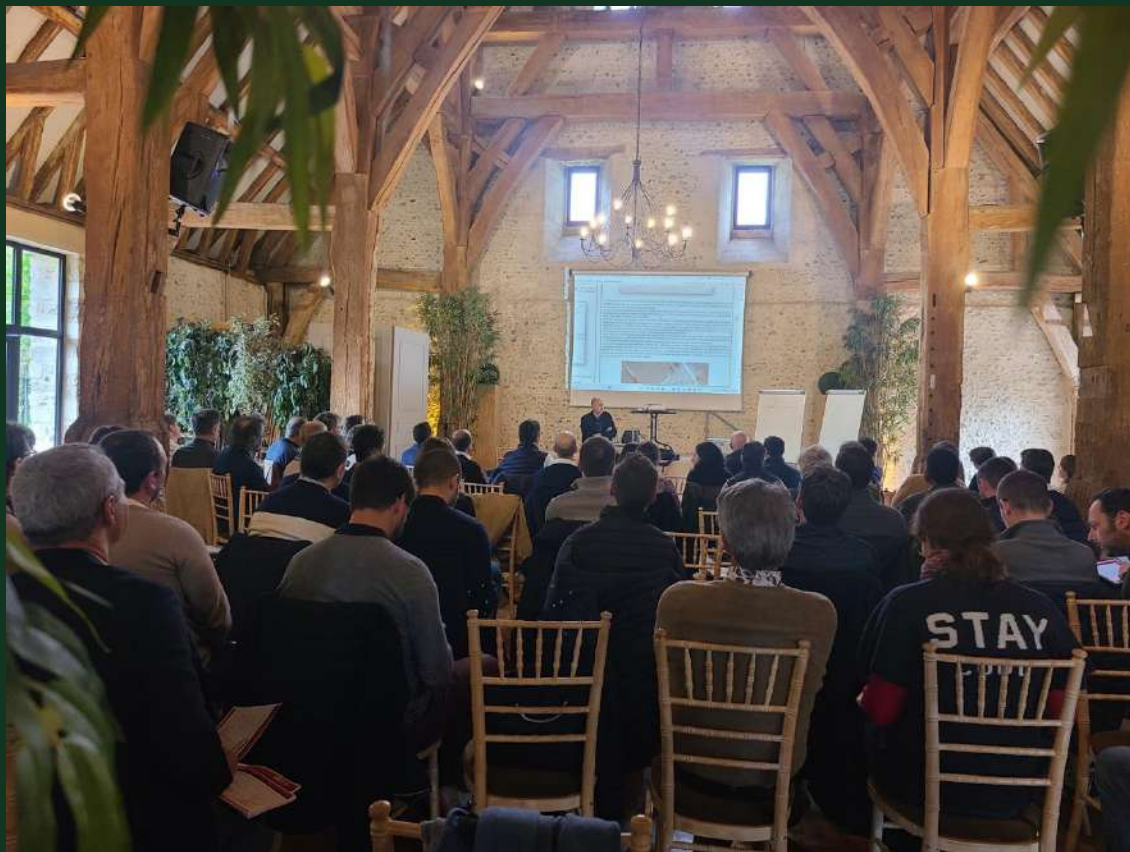
Réunion de type plénière : configuration théâtre ou cabaret

La capacité de la salle permet de proposer différentes configurations.